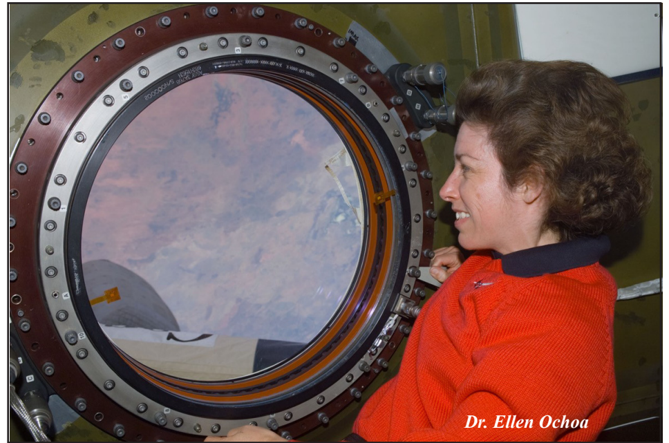
Dr. Ellen Ochoa