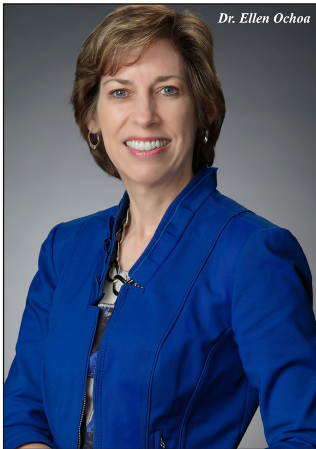
Dr. Ellen Ochoa