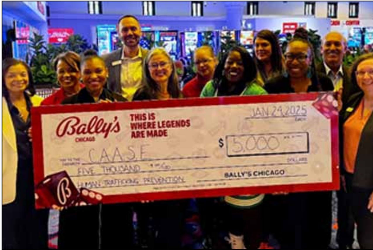
El Casino Bally's Chicago está tomando medidas agresivas hacia el tráfico de personas, lanzando un programa integral de capacitación de empleados contra la trata de personas. En reconocimiento del

Mes de Concientización Sobre la Trata de Personas, Bally's Chicago igualó el programa de "Da $5, Recibe $10" campaña de contribución a beneficio de Chicago Alliance Against Sexual Exploitation (CAASE), donde los clientes reciben un juego gratis por donar a una organización benéfica local durante el mes de enero. El extensivo programa de entrenamiento educa a los empleados en sesiones semanales sobre como el trafique puede estar presente en la comunidad que nos rodea, entrenó a los miembros del equipo sobre posibles indicadores de trafique que puedan encontrar dentro del casino y empoderarlos para responder apropiadamente si sospechan que hay presente alguna actividad de trafique. La campaña de contribución a organizaciones benéficas "Da $5, Recibe $10" ben-