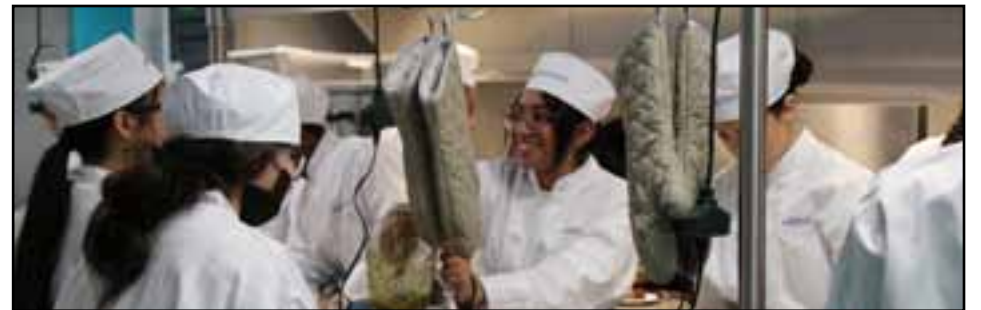
Los adolescentes pueden solicitar cientos de programas en la ciudad esta primavera a través del Programa After School